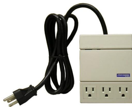
概観寸法 mm (本体)